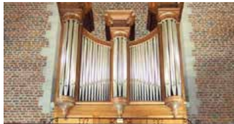
Orgue De Volder de Quarouble

de découvrir l'éventail des instruments de musique reproduit par cet orgue de 1840, unique en France par sa technologie. Le retour s'est fait par le circuit des chapelles Saint-Rémy et Saint-Roch. Un repas sous chapiteau à Marchipont a clôturé cette journée dans une excellente ambiance de retrouvailles. Pour commémorer les 10 ans de la marche de Saint-Jacques, un set de table a été remis à chaque participant au repas et une messe a été célébrée dans l'église tricentenaire le dimanche 17 septembre.