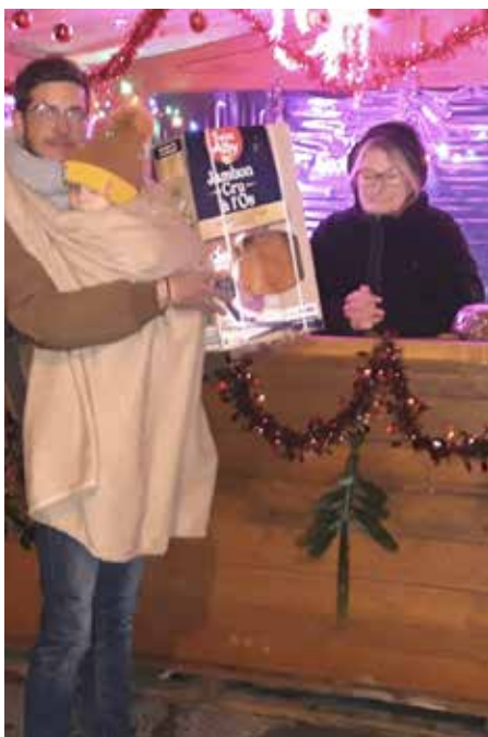
Le gagnant d'un jambon cru de la tombola du marché de Noël.