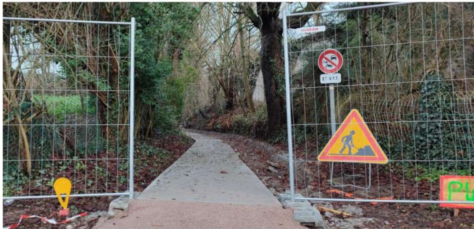
À Sebourg, le chemin de la Petite-Cavée est l'un des points de passage de la Boucle de l'Aunelle. Les travaux, en cours, s'étalent jusque fin janvier.

Valenciennes Métropole a décidé d'aménager cinq boucles cyclables, des liaisons douces, qui viendront mailler le territoire et mettre en valeur son patrimoine historique et naturel. À Sebourg, des chemins piétonniers sont en travaux et déjà interdits d'accès pour la réalisation de l'un de ces parcours.