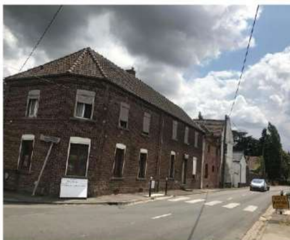
La ferme Delvallée se trouve sur la route du Quesnoy, à la frontière de Quiévrechain, juste avant la coupure de route.

Le maire : « Nous aussi nous aimerions la réouverture, mais... »