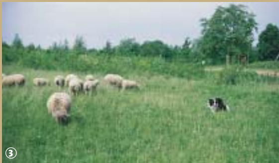
Pâturage extensif par des moutons;

Les noms donnés aux anciennes carrières d'Abscon et d'Escaudain peuvent induire en erreur quant à la matière première qui y était réellement produite. En effet il ne s'agissait en aucune façon de fabri-