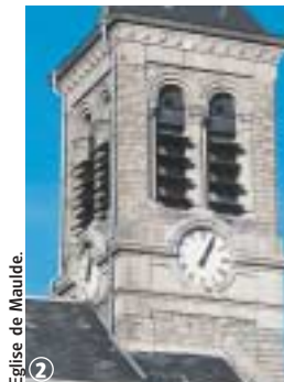
Eglise de Maulde.