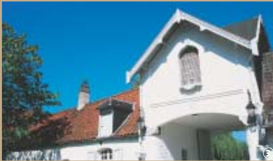
Cense de Wabempré.

Les moines, venus évangéliser le Hainaut au VII e siècle, ont laissé à jamais leurs empreintes sur le patrimoine naturel, architectural et culturel du pays.