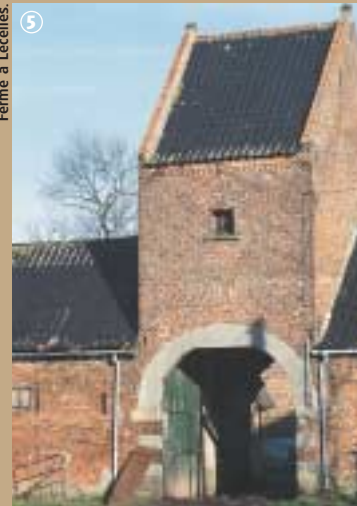
Ferme à Lecelles.

fièrent, aux VII e et VIII e siècles, des villas au bord de l'eau, exploitées par les moines. A partir des XII e et XIII e siècles, les abbayes préférèrent concéder les exploitations à de riches laboureurs en échange de revenus. C'est ainsi que sont nées les censés. Littéralement le cens est la redevance payée par le paysan à son seigneur ; le paysan prend alors le nom de censier et cense devient aussi la ferme dans son ensemble. Construite généralement en brique, la toiture couverte de tuiles, elle est de forme carrée et son entrée est souvent surmontée d'un pigeonnier. A l'habitation proprement dite, se juxtaposent les bâtiments de service tels