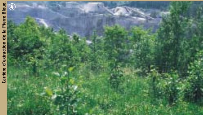
Carrière d'extraction de la Pierre Bleue.

Enfin, dans les fermes, la pierre bleue, imperméable, permettait de réaliser des auges, des abreuvoirs, des caniveaux et même des box de chevaux.