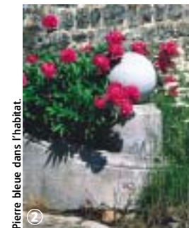
Pierre bleue dans l'habitat.