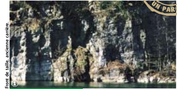
Front de taille, ancienne carrière.

Randonnée Pédestre Sentier des Carriers : 2 ou 6,5 km