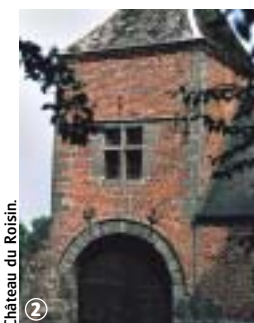
Château du Roisin.

Ce circuit transfrontalier emprunte des petites routes et des chemins agricoles. Le site classé du Caillou-qui-Bique invite à un comportement respectueux. En période de pluie, certaines portions humides nécessitent un équipement adapté.