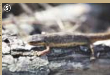
Titon en phase terrestre.

*L'Almanach du Parc Naturel des Hauts-Pays 2002 raconte cette légende du Caillou qui Bique en s'inspirant de la monographie « Au Pays des deux Honnelles » de Paul Eveve, sortie à l'enseigne de la Fédération du Tourisme de la Province du Hainaut en 1967.