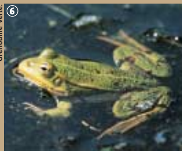
6 Grenouille verte

En levant les yeux sur les arbres, fruits, feuilles et bourgeons composent le repas favoris des chenilles, charançons et autres hametons... Oui, mais voilà que le Pic-mar et le Pic-vert son cousin surgissent et avalent goulûment