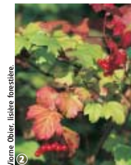
2 Viorne Obier, lisière forestière