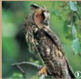
3 Hibou moyen duc

Fraîcheur et plénitude de l'aube en Forêt de Mormal... En s'avancant doucement dans cette étendue verte où la nature s'éveille, d'abord les yeux baissés sur le sol et la litère forestière, on ne soupçonne que trop peu le travail immense des décomposeurs, ces milliers d'invertébrés, bactéries et champignons qui dégradent et transfor-