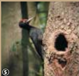
5 Pic noir

ment la matière organique en éléments minéraux assimilables par les végétaux. Par temps humide et chaud, la terre multicolore devient le paradis des grenouilles ; une joyeuse danse ponctuée de tics rythmiques, amènera le batracien à domicile : un point d'eau tout simplement.