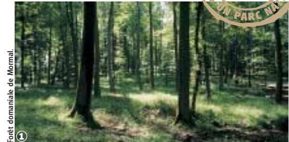
1 Forêt domaniale de Mormal

Randonnée Pédestre Circuit des Pâtures : 7,5 km