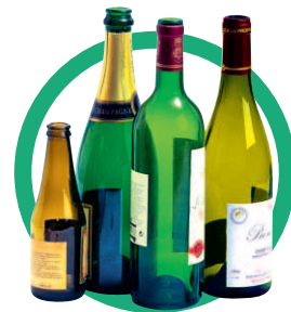
Bouteilles, bocaux et pots vides en vrac sans bouchon, ni capsule, ni couvercle