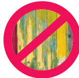
Bois peint ou vernis