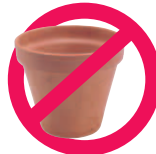
Pot en terre