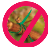
Liens plastique / métal