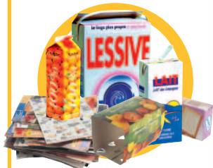
Papiers, cartons et briques alimentaires non déchetés