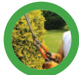
Tailles de haies (en fagots liés avec ficelle - 1m maxi)