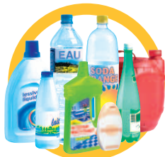
Bouteilles et flacons en plastique vidés