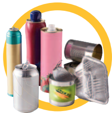
Conserves, canettes en métal, barquettes alu ...

Ne pas imbriquer ces emballages les uns dans les autres