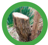
Troncs d'arbres (10 cm diamètre maxi)