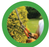
Tailles de haies (en fagots liés avec ficelle - 1m maxi)