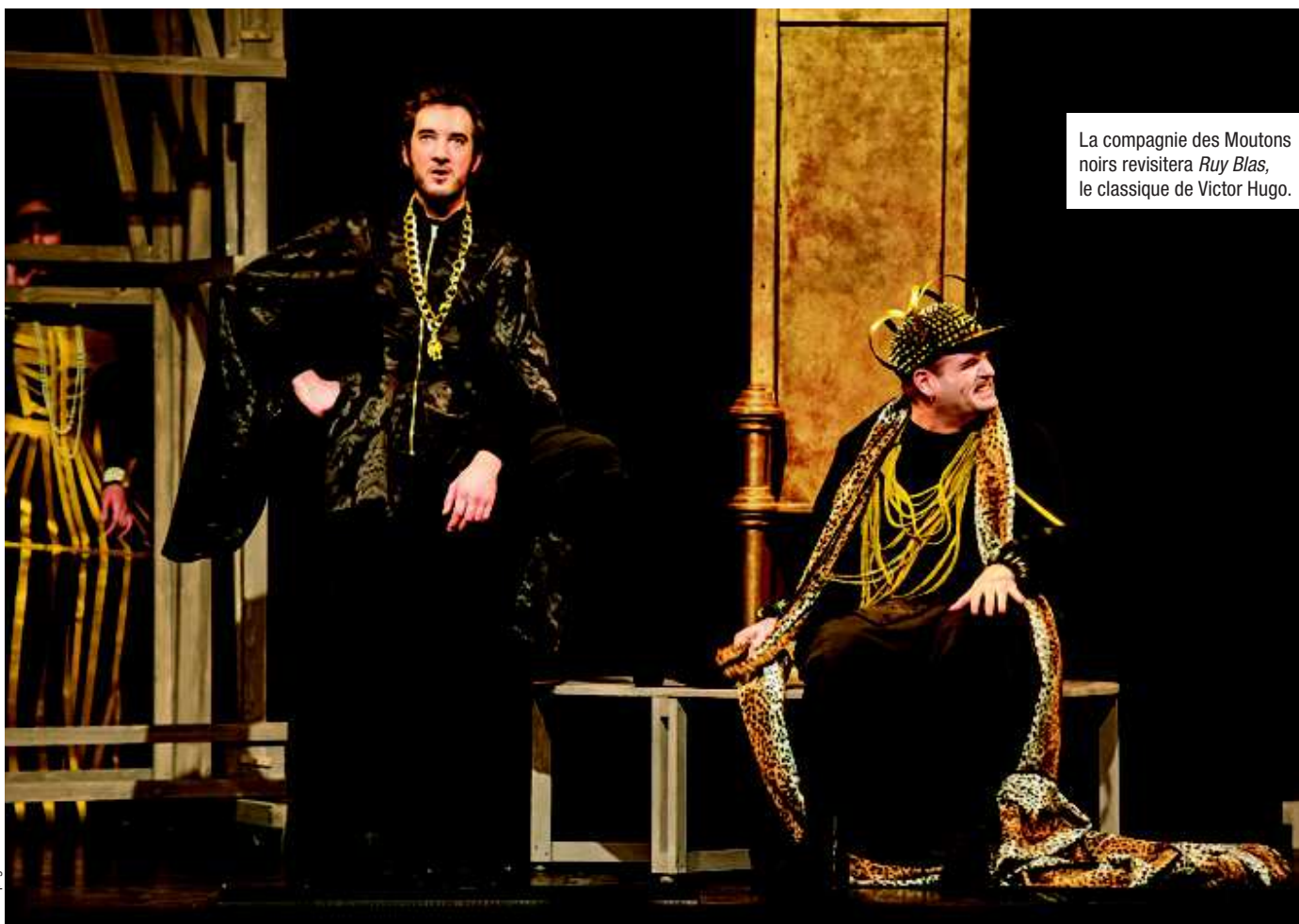
La compagnie des Moutons noirs revisitera Ruy Blas , le classique de Victor Hugo.