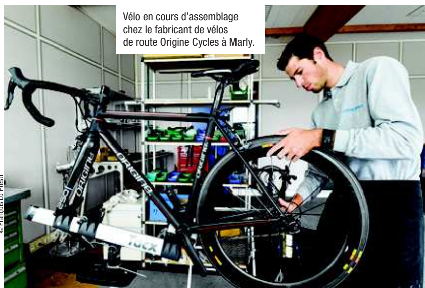
Vélo en cours d'assemblage chez le fabricant de vélos de route Origine Cycles à Marly.