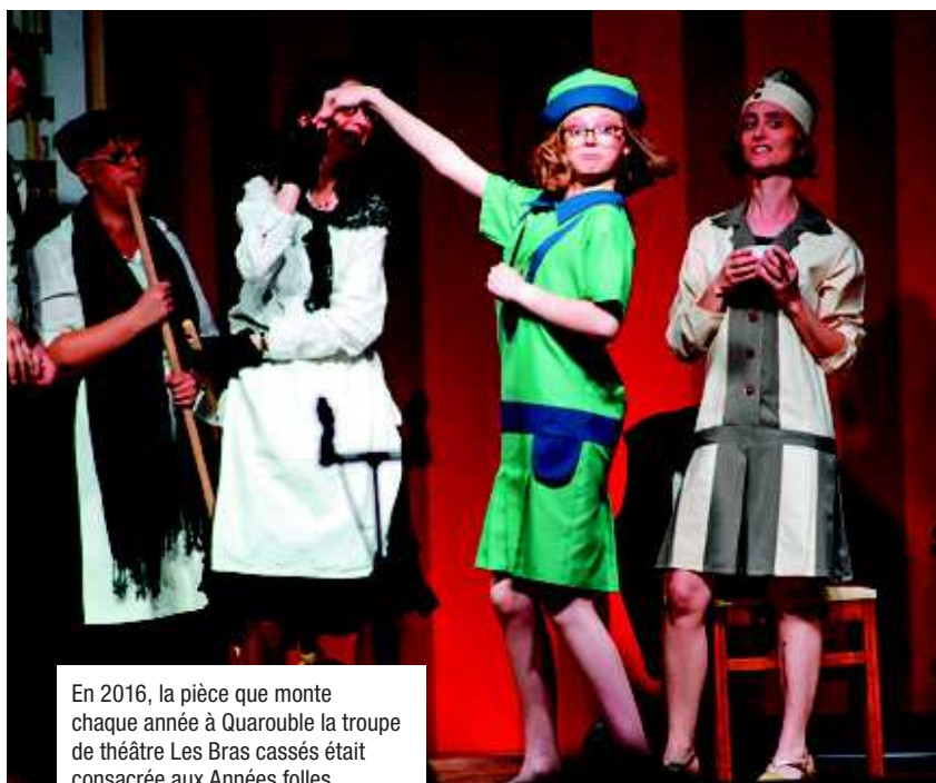
En 2016, la pièce que monte chaque année à Quarouble la troupe de théâtre Les Bras cassés était consacrée aux Années folles.