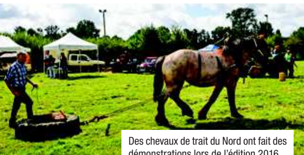
Des chevaux de trait du Nord ont fait des démonstrations lors de l'édition 2016.