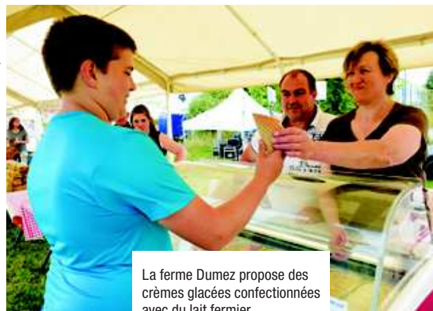
La ferme Dumez propose des crèmes glacées confectionnées avec du lait fermier.