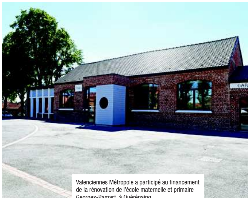
Valenciennes Métropole a participé au financement de la rénovation de l'école maternelle et primaire Georges-Pamart, à Quérénaing.