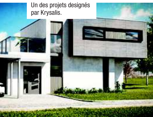
Un des projets conçus par Krysalis.