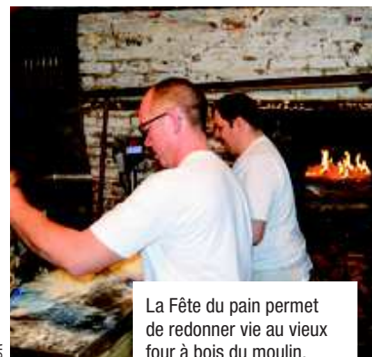
La Fête du pain permet de redonner vie au vieux four à bois du moulin.

Contact : fil@valenciennes-metropole.fr Association Méninges en récré : dominique.langlet@sfr.fr Compagnie Les Bras cassés : http://osettesbrascasses.e-monsite.com/