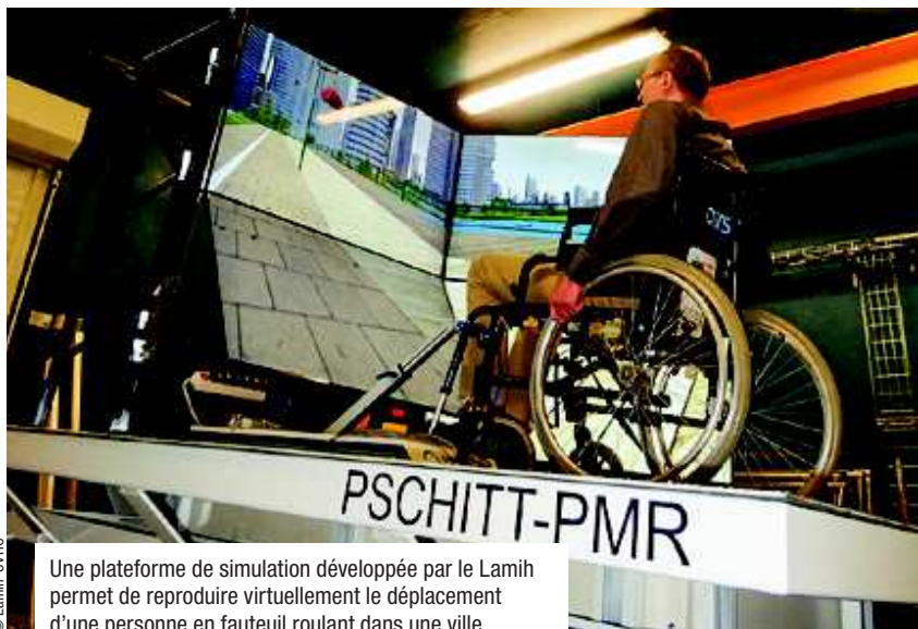
Une plateforme de simulation développée par le Lamih permet de reproduire virtuellement le déplacement d'une personne en fauteuil roulant dans une ville.