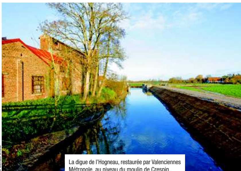
La digue de l'Hogneau, restaurée par Valenciennes Métropole, au niveau du moulin de Crespin.

Limiter les conséquences des crues est l'autre volet de l'action communautaire. Des digues et des zones d'expansion de crues ont ainsi été réalisées ou consolidées. Les berges sont régulièrement nettoyées et les obstacles dans les rivières éliminés afin de faciliter la circulation de l'eau. À Crespin et Thivencelle, Valenciennes Métropole gère 6 kilomètres de digues sur l'Hogneau. D'autres chantiers sont à venir sur la Rhônelle d'ici à 2018 et sont à l'étude sur le Courant du Rôleur. ●