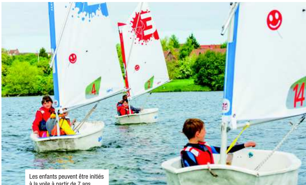
Les enfants peuvent être initiés à la voile à partir de 7 ans.