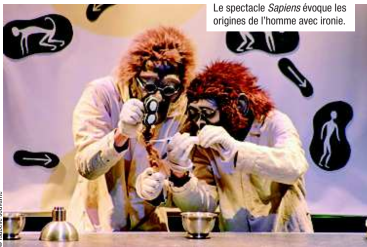
Le spectacle Sapiens évoque les origines de l'homme avec ironie.