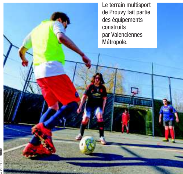
Le terrain multisport de Prouvy fait partie des équipements construits par Valenciennes Métropole.

20 plateaux multisports ont ainsi été réalisés à Artres, Hergnies, Saint-Aybert, Thivencelle, Quérénaing, Vicq, Famars, Crespin, Préseau, Quarouble, Rombies-et-Marchipont, Sebourg, Curgies, Verchain-Maugré, Saultain, Aubry-du-Hainaut, Prouvy, Maing Monchaux-sur-Écaillon et Odomes. Ces plateaux sont accessibles à tous et en toute sécurité. Ils permettent la pratique de nombreuses disciplines : football, tennis, volley-ball, basket, handball. Ils accueillent également les écoles, les associations, les centres aérés... Par ailleurs, une salle multisport a été créée à Estreux pour répondre aux besoins des communes ne possédant pas ce type d'équipement. ●