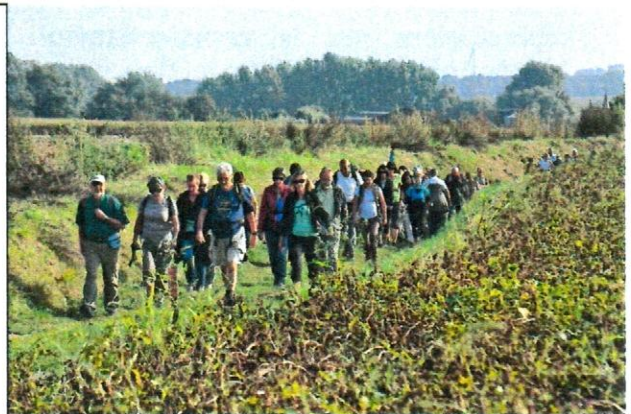
Marche 2014 dans le Chemin de la Roquette

Réservation en Mairie 03.27.27.32.48 ou par mail : intranet-rombies@orange.fr